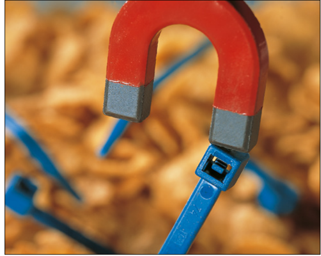
Serie MCT con contenido metálico.