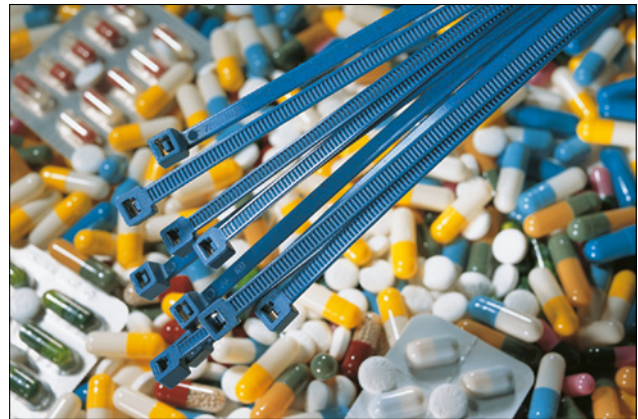
Producciones seguras y sin contaminación usando Bridas MCT