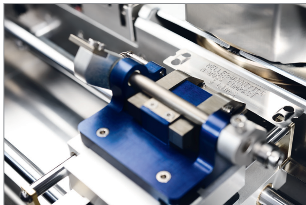
Uma ampla gama de tamanhos de placas para se adaptar às suas necessidades.

Por exemplo: Para uma aplicação solar, poderia receber as suas placas de identificação de cabos, não só impressas, como também com as abraçadeiras fixas, e seriam entregues juntos os «positivos com os negativos», para além de que cada «string» seria vendido por separado.