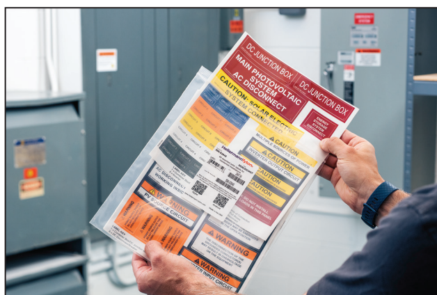
As etiquetas impressas e visíveis, identificam os ativos de grande qualidade.