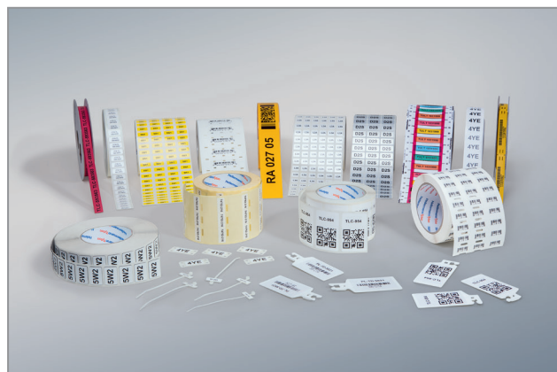
Ampla gama de etiquetas e placas, em diferentes materiais, dimensões e cores.