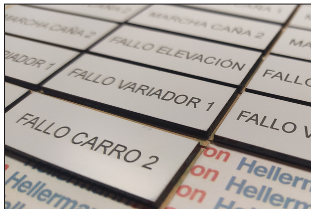
Placas plásticas bicapa com adesivo.