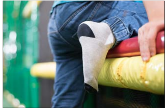
Serie PE - Las bridas de Cabeza Plana minimizan el riesgo de lesiones y al mismo tiempo fijan con facilidad el material.