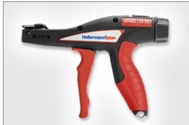
EVO9 con Tecnología TLC.